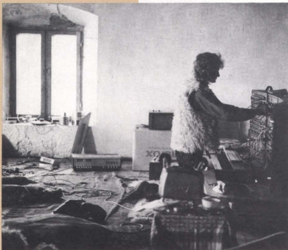
Florian Fricke, 1971

Wenn jemand meine Musik hört, kann er sich verwandeln, wieder zu seiner Seele zurückfinden