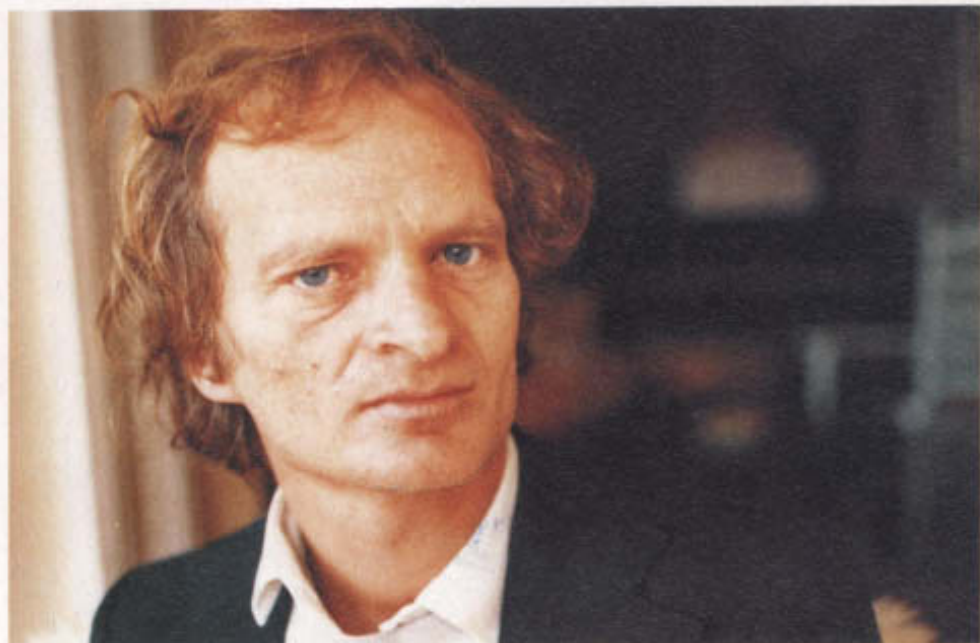
Florian Fricke, 1989